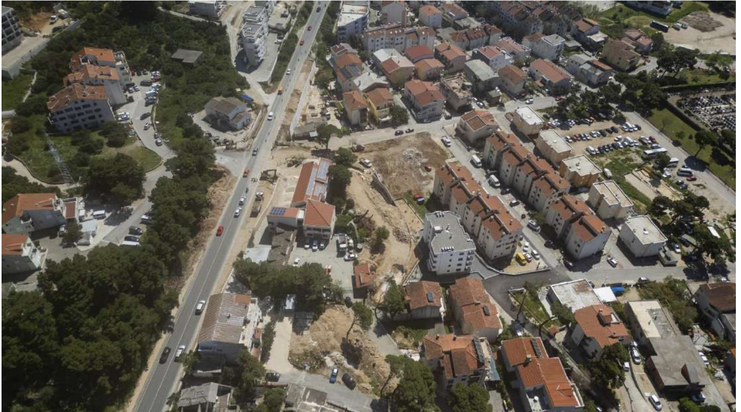
Snimak dronom gradilišta spoja Kotiške ulice na magistralu u Makarskoj, 06.04.2024