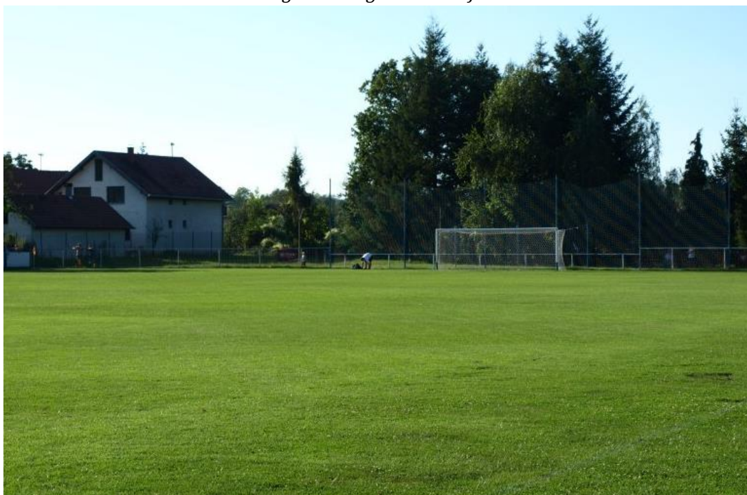
Slika 1. Nogometno igralište Donja Motičina