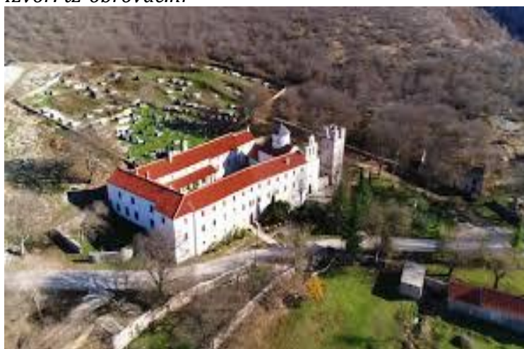
Slika 6. Manastir Krupa