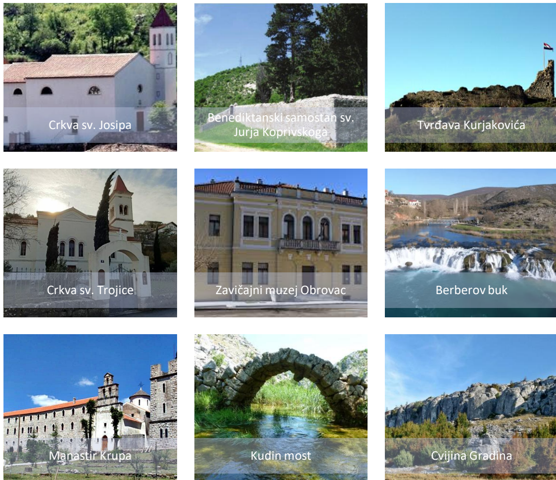
Slika 1. Kulturna i prirodna dobra