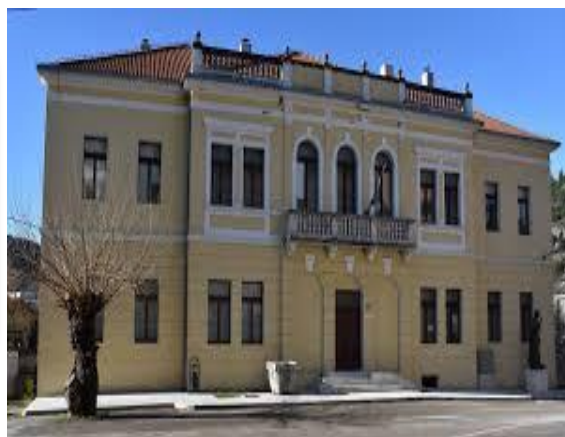
Slika 7. Zavičajni muzej Obrovac