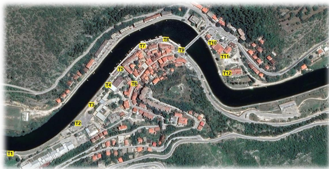
Slika 2. Pristupne točke besplatnog Wi-Fi-a i Obrovcu

Na području Obrovca postoji dostupnost širokopojasnog interneta, a grad je dio inicijative WiFi4EU, u sklopu koje je postavljeno 12 pristupnih točaka besplatnog Wi-Fi-a na važnim javnim lokacijama. Unatoč tome, optička mreža nije ravnomjerno razvijena, posebno u prigradskim i ruralnim naseljima, što ograničava digitalnu transformaciju lokalnih pružatelja usluga, gospodarstvenika i turističkih subjekata.