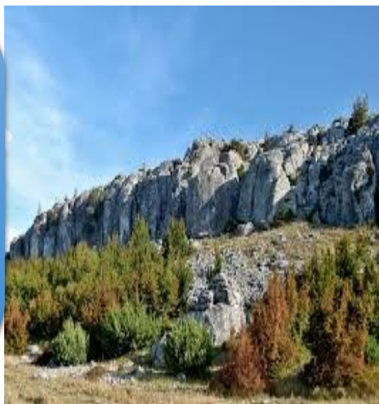
Slika 8. Cvijina gradina

Kako bi donositelji odluka, turističke zajednice i poduzetnici, bolje razumjeli potencijal atrakcija te usmjerili resurse na najvažnije segmente, ocjenjuju se razvojni i marketinški potencijali koji su potrebni za analizu potencijala daljnjeg razvoja i podizanja kvalitete turističkih proizvoda.