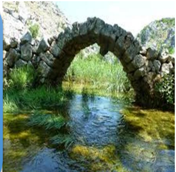
Slika 4. Kudin most